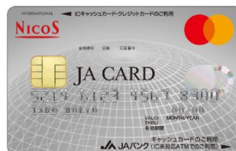
【JAカード（クレジット）】

まずは別紙「ジュンテンドー利用による「おさいふカード会員」特典申込書」を持参の上、最寄りのジュンテンドー店舗にてお手続きを行ってください。