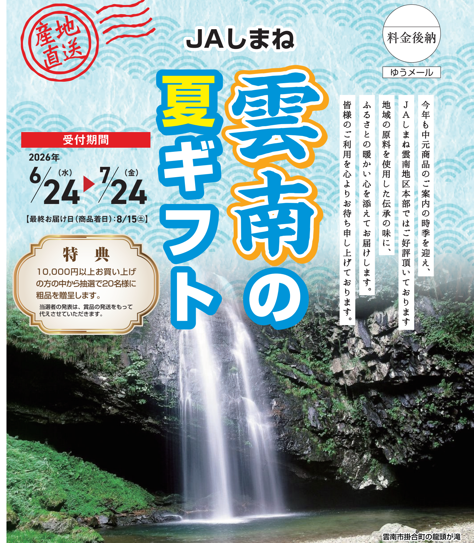
雲南市掛合町の龍頭が滝

今年も中元商品のご案内の時期を迎え、 JAしまね雲南地区本部ではご好評頂いております 地域の原料を使用した伝承の味に、 ふるさとの暖かい心を添えてお届けします。 皆様のご利用を心よりお待ちしております。