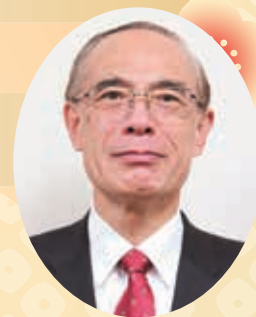
島根県農業協同組合 やすぎ地区本部