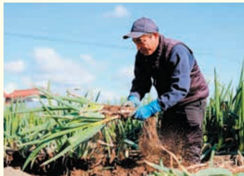
雨が降ると作業工程が増えるため、晴れの日に多めに収穫するなど事前に調整しながら収穫を進めます