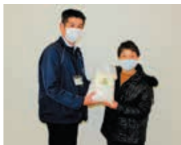
フードバンクへ米を寄贈する 寺内副部長(右)

今年も私達女性部に変わらぬご指導、ご協力をお願いすると共に皆様のご健康とご多幸をご祈念申し上げます。新年のご挨拶とさせていただきます。