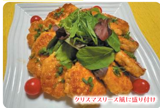
クリスマスリース風に盛り付け