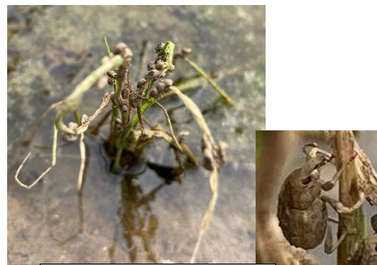
写真：イネクロカメムシ被害株