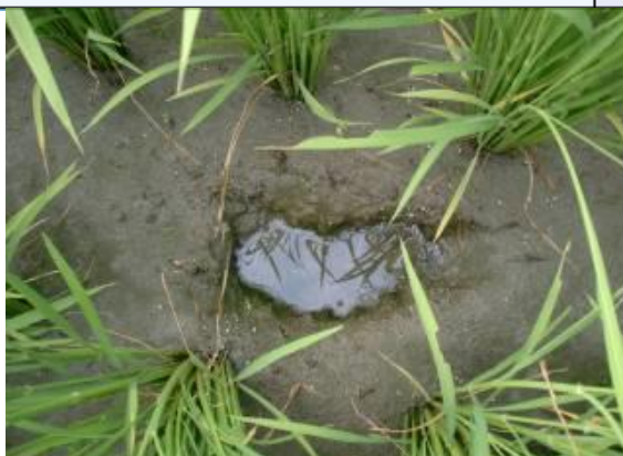
田面の足型に水が残る程度には水分を保つ (飽水管理)