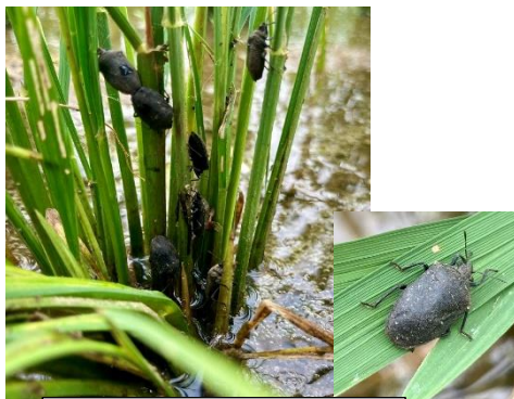
写真：イネミズゾウムシ被害株