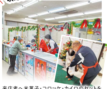
来店者へ米菓子・コロッケ・カイロのセットをプレゼント。アンケートを実施し、抽選でしめ縄をプレゼントしました。女性部のほか、地元団体、地元保育園児などの作品展や「つがが工房」による出張販売も行いました。