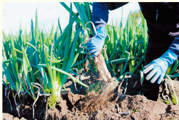
丁寧に収穫していきます

めの際も、葉が折れないように慎重に入るなど、最後まで気を遣う作業が続きます。病気に弱く、害虫もつきやすい上に、大雨などで水に浸かっ