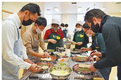
「おにぎらず」を作る様子

料理教室に参加した若手警察官は「自分で作るのは楽しい」と笑顔で話し、交流を深めながら楽しく調理しました。