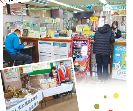
来店者へ卵とカイロをプレゼント。アンケートを実施し、抽選で鉢植えをプレゼントしました。