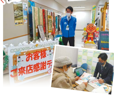
来店者へパイ・卵・カイロのセットをプレゼント。共済の特設ブースでは、VRゴーグルで農業車両事故の疑似体験を実施したほか、webマイページやJAバンクアプリを紹介しました。