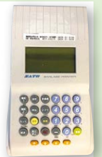
小型シール発行機 barlabe KE

◎小型シール発行機は、長期使用による消耗や老朽化および砂埃等により、故障が続出ておりますので、定期的なメンテナンスと発行機業者との保守契約をお勧めいたします。 ◎小型シール発行機barlabe KE(右の写真)は販売終了から10年が経過し、メンテナンスおよび設定変更が出来ませんのでご了承ください。 小型シール発行機への追加登録や表示内容の修正が必要な方は、講習会開始時間より少し早めに会場へお越しくださいませようお願いいたします。