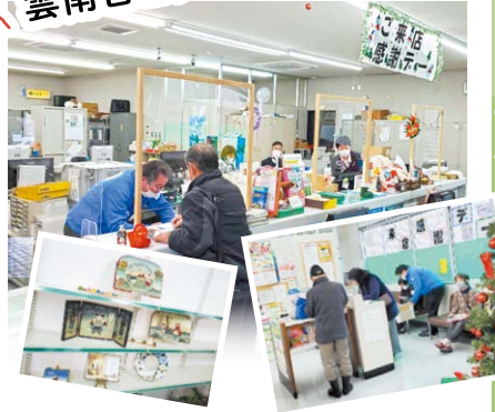
来店者へお茶菓子・コーヒー・カイロのセットをプレゼント。アンケートを実施し、抽選で吉田町の特産品をプレゼントしました。女性部のほか地元小中学生の作品展なども行いました。