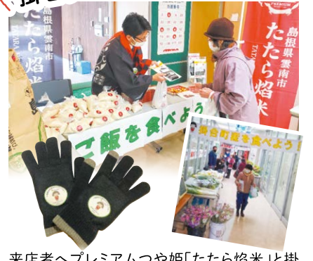
来店者へプレミアムつや姫「たたら燻米」と掛合支店オリジナル手袋をプレゼント。地元でとれた新鮮野菜も販売し、地元農産物の消費拡大をPRしました。抽選で「奥出雲和牛カレー」もプレゼントしました。