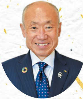
JALまね雲南地区本部 常務理事本部長