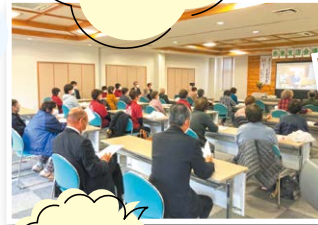
赤来会場の みなさん