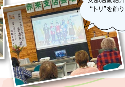
赤来支部が 支部活動紹介動画の “トリ”を飾りました