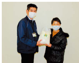
フードバンクへ米を寄贈する 寺内副部長(右)

今年も私達女性部に変わらぬご指導、ご協力をお願いすると共に皆様のご健康とご多幸をご祈念申し上げます。新年のご挨拶とさせていただきます。