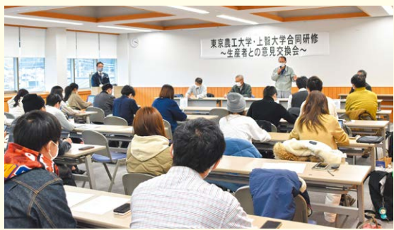
▲農事組合法人みなさんと意見交換を行う学生ら

新型コロナウイルスの影響で開催できなかった授業もありましたが、今年度はスクール生の自宅でトウモロコシの苗やバケツ稲を育て、育てる大変さや楽しさ、収穫の喜びを親子で体験しながら、楽しく「食と農」の大切さを学びました。