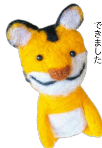
素敵な寅ができました

9月には羊毛フェルトで今年の干支「寅」を作る手芸講座を開き、多くの部員が参加しました。