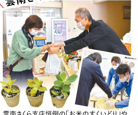
雲南さくら支店恒例の「お米のすくいどり」や、みとや青空ふれあい市場による出張野菜市を実施。来店者へ卵と女性部のみなさんが大切に育ててくださった多肉植物をプレゼントしました。