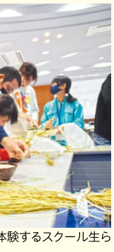
▲野球ボールとすり鉢を使って粃摺りを体験するスクール生ら

めぐりキッズスクールは12月18日、雲南地区本部で第14期生の修了式と最後の授業を行いました。