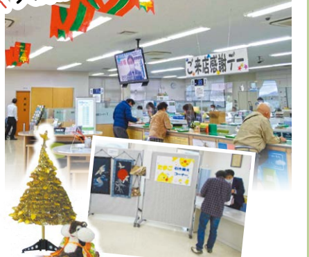
来店者へ卵とカイロをプレゼント。自動車共済・各種ローン相談者へ奥出雲和牛カレーをプレゼントしました。