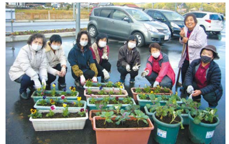
元気が花が育つよう、土づくりから行いました

加茂支部では、支店を利用いただく組合員・利用者のみみなさまへ「おもてなし」の想いを込めて「おもてなし活動」に取り組んでいます。