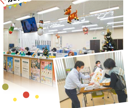
来店者へカイロ・BOXティッシュ・入浴剤のセットをプレゼント。防犯意識を高めてもらおうと、詐欺防止のチラシ配布と声掛けをしました。