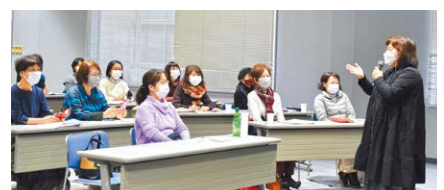
口角をいつもの3倍あげるように意識するとマスクをしていても笑顔が伝わるそうです

学生は、「自分がハッピーになることでコミュニケーションが良くなることや、声を出すこと、良く笑うことがとても大切であることを改めて感じた。今日から早速実行してみたい」と感想を述べました。