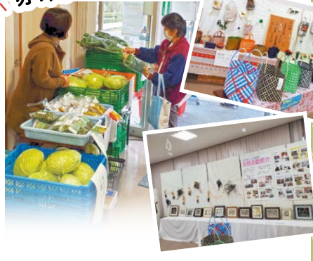
来店者へ卵をプレゼント。アンケートを実施し、抽選で花をプレゼントしました。女性部のほか、地元保育園児の作品展や、地元でとれた新鮮野菜の販売なども行いました。