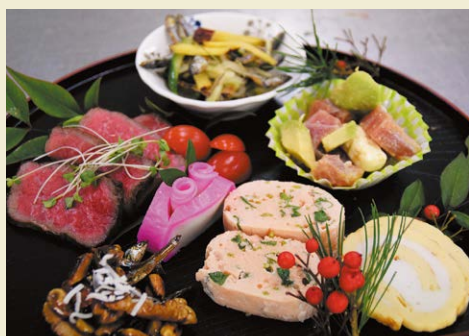
▲プロ顔負けのプレートが完成しました

参加者は「忘れかけていたおせち料理の大切さに気づくことができた」「食を通して日本の文化を家庭で守っていききたい」と笑顔で話しました。