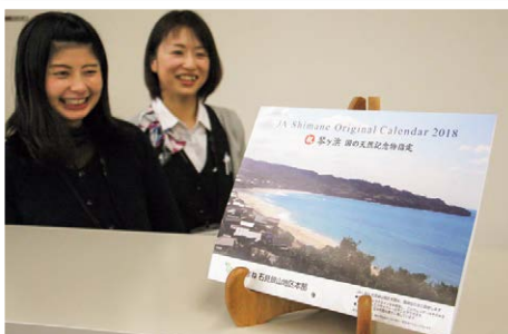
琴ヶ浜が表紙を飾るJAオリジナルカレンダー