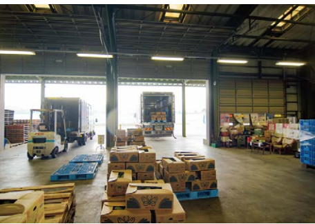
中海干拓事業所にある集荷場から市場へ