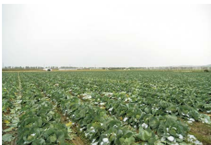
広大な農地で栽培されるくにびきキャベツはこれから最盛期を迎える

小室さん 松江地区でのキャベツ栽培はほとんど、この中海干拓地の掛屋工区で栽培されています。全体の作付面積は約37ヘクタールで、2016年は秋の長雨等の影響もあり、例年より少ない、730トン出荷しました。年間の目標出荷量は、多い時の実績と同じ、1,000トン以上を目標にしています。営農当初は栽培面積を拡大しても生育が不安定な時もありま