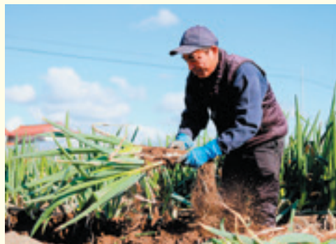
雨が降ると作業工程が増えるため、晴れの日に多めに収穫するなど事前に調整しながら収穫を進めます